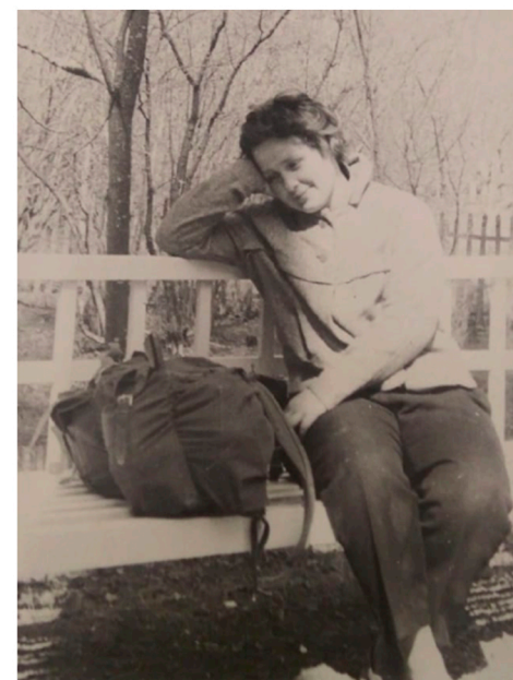
В минуты отдыха