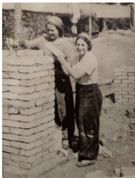
Студенческая молодость в стройотряде