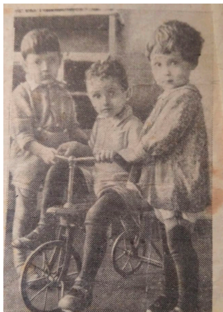
В детском саду