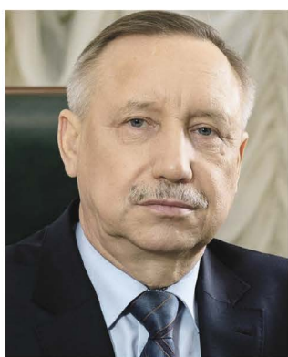
Александр БЕГЛОВ, губернатор Санкт-Петербурга